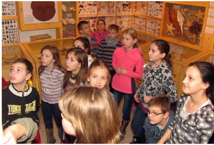
Nézünk, mint a... Természetárban!

A harmadik kirándulás helyszíne a debreceni Mediterrán Élményfürdő, vagy másik nevén Aquaticum volt. Itt kiváló alkalmunk nyílt biztonságos körülmények között megtapasztalni, hogy milyen ereje van a víznek. A gyerekek egy verseny során kipróbálhatták, milyen nehéz az egyre mélyülő vízben gyorsan haladni. A körmedencében pedig feladatul kapták, hogy próbáljanak ellenállni a víz sodrásának. Így halvány képet kaphattak arról, milyen lehet egy vadvízi patakon törekeny kenuval utazva a víz erejének kiszolgáltatva lenni. Saját bőrükön tapasztalva a víz erejét, összehasonlíthatták, milyen nagy a különbség a folyásirányban és azzal ellentétesen haladó vízi közlekedés között.