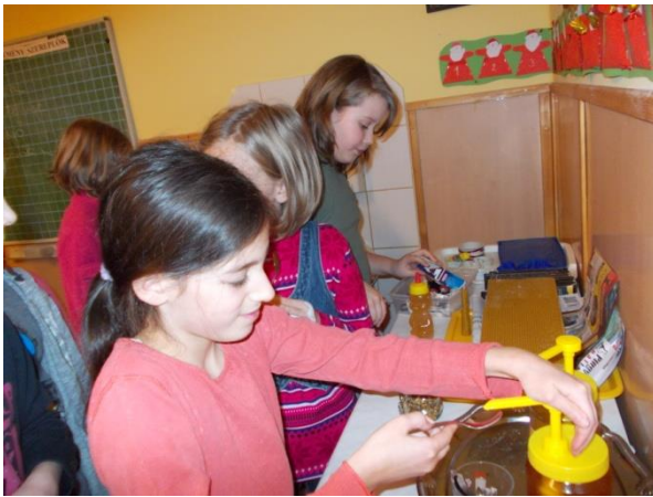
Mézkóstolás – A méhek hasznos állatok!