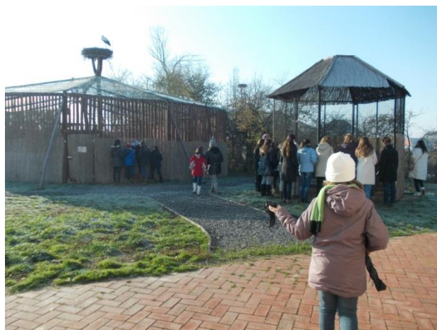
„Vizitelés” madárkórház betegszoba- ablakainál Az udvaron tágas röpdékben lábadoztak a betegek