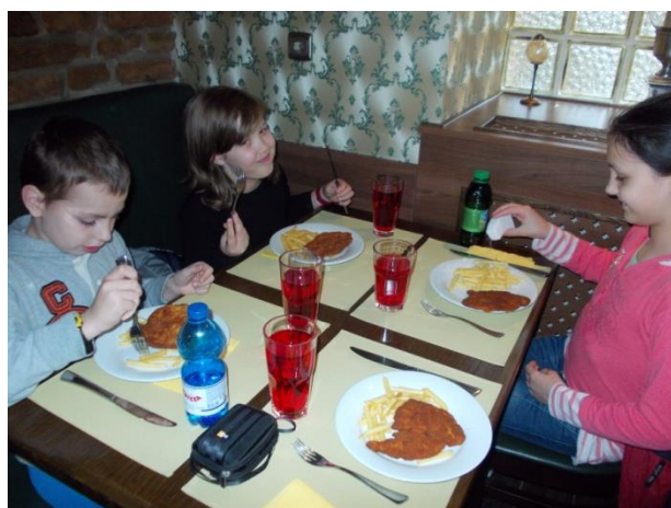
Telik a pocak, nő a mosoly