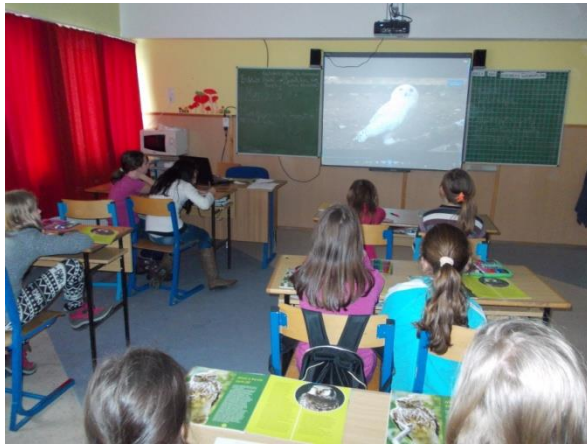
A baglyok nemcsak szépek, hasznosak is!