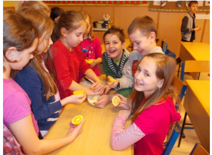
A citrom sokat utazik, míg mi is élvezhetjük