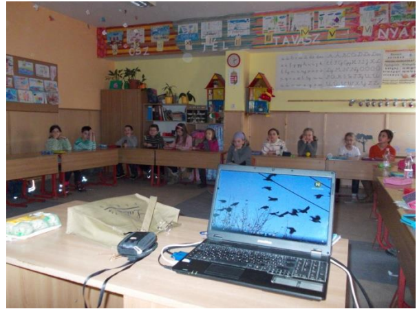
A varjak galibát okozhatnak az áramellátásban