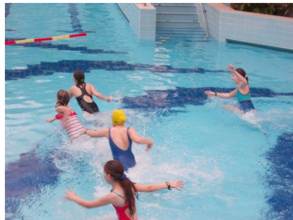
Dacolva az elemekkel

A „Nemszeretem állatok” sorozatban ezúttal a méhekkal, a varjakkal és a baglyokkal ismerkedtünk meg, minden esetben kihangsúlyozva ezen teremtmények hasznosságát, rombolva a hozzájuk kötődő tévhiteket és rávilágítva sok érdekességre, valamint megvizsgáltuk, milyen kapcsolatuk van, vagy milyen hatással van rájuk az emberi közlekedés, esetleg ők milyen hatással bírnak erre nézve. A Szitakötő folyóirat több cikke is kapcsolódott témáinkhoz, megkönnyítve az ismeretszerzést. A foglalkozásokat a tanulást segítő egyéni és csapatversenyekkel tettük színesebbé, a győzteseket természetesen minden alkalommal jutalmaztuk is.