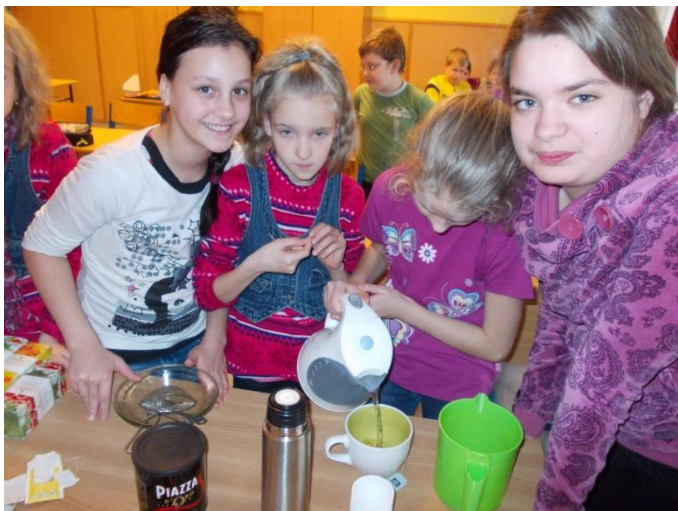
Így készül a tea

A hideg idő beköszöntével ismét elővettük a teafüveket és a teakészítés módjait is felelevenítettük. A gyerekek ki is próbálhatták ezeket, miközben megtanulták, hogy melyik teafélét milyen eljárással érdemes elkészíteni, hogy a legoptimálisabb hatást, vagy ízt érthessük el. A téma érdekessége volt, hogy a tea ízesítéshez oly sokszor használt déli gyümölcsöket (citrom, lime, narancs) messzi vidékekről szállítják hozzánk vízi úton és közutakon. Hosszú idő, míg ide érnek, épp ezért különböző módokon vegyszerekkel kezelik a gyümölcsöt, amit fogyasztás előtt feltétlenül meg kell mosni.