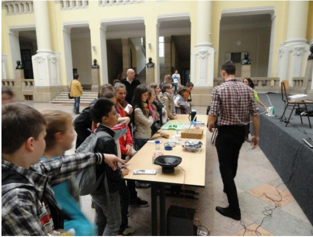
A kutatók éjszakáján

egyszerű weblapokat készítettünk, gombafajták, és halfajták bemutatására, egy-két gomba és halrecepttel is gazdagítva biológiai ismeretek mellett. A Kompozerrel egyszerűen tudunk váltani a grafikus és a html nézet között így ezekkel a váltásokkal elő tudtam készíteni a html programozás hangulatát.