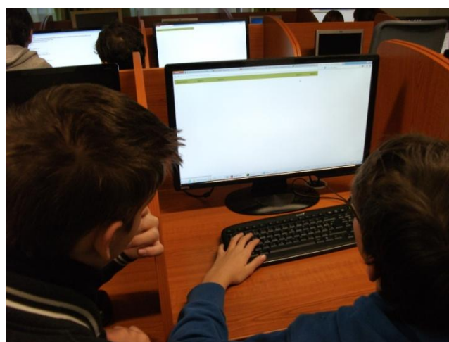
A HTML elemek átírásával saját menüsört készítettünk

HTML fájlokat készítettünk. Volt olyan feladat, amikor egy félkész alap weblapot kellett átalakítani, ehhez természetesen a HTML kódok erős ismeretére volt szükség. Megtanultuk azt hogy az interneten gyakorlatilag szinte minden megtalálható, nagyon sok olyan programozó és web szerkesztő felhasználó van aki a kitapasztalt és elkészített HTML-kódjait ingyen rendelkezésre bocsájtja. Január hónap első felében ilyen kódokat kerestünk és bővítettük ki a weblapjaink dizájnját és funkcióit. (látogatottságmérőt, hőésést, bejelentkező ablakot, képváltót és sok hasznos holmit találtunk a weblapjainkhoz) Január második felében 3 fős csoportokban egy tetszőleges ötlet alapján egyéni weblapokat terveztünk. Februárban egy weblapkészítő verseny felhívása alapján 3 fős csapatokban az Iskolánkat bemutató weblapot kell 5 megabájt méretben elkészíteni, most ezen dolgozunk.